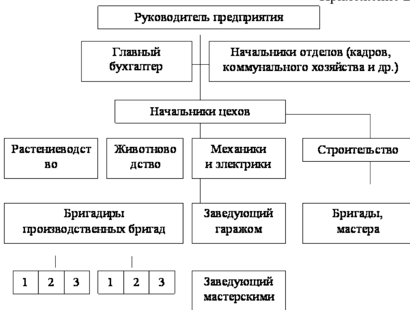
Рисунок 2 - Схема цеховой структуры управления