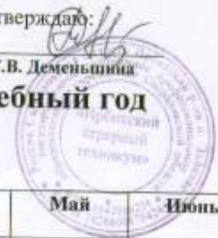
График учебного процесса по заочной форме обучения на 2020 - 21 учебный год